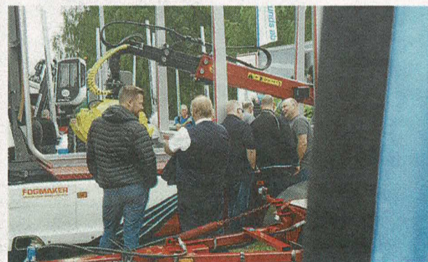
Många var nyfikna på vad utställarna hade att erbjuda.