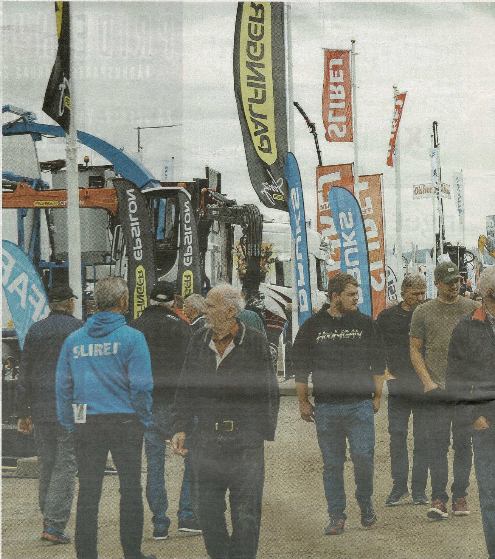
Många lockades till Mittiamässan under fredagen.

Mail: tips@helahalsingland.se MMS/SMS: Skicka meddelande till 72 023. Inled ditt SMS/MMS med HH.